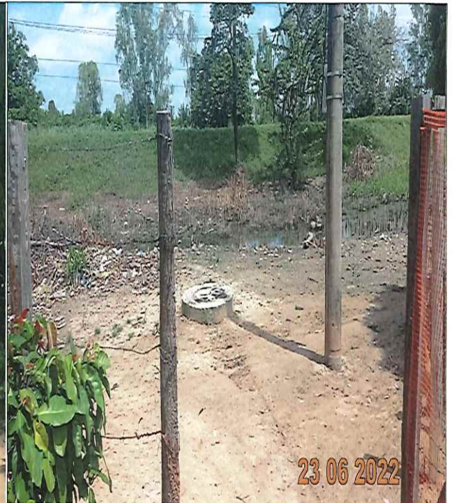
Visita de Verificación R_34714